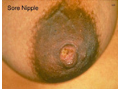
Meme Başı Çatlağı

Meme Başı Çatlağı: Memeye yanlış yerleştirme, dolu meme, mantar enfeksiyonları, bebeğin memeyi çok kuvvetli emmesi veya emzirme sonrası memenin birden bebek ağzından çekilmesi sonucu gelişebilir.