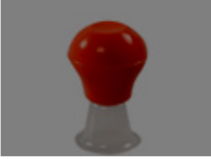
Meme Başı Çıkarıcılar

Meme Başı Çöküklüğü ya da Düz Meme Başı: Emzirmeye engel bir durum değildir.