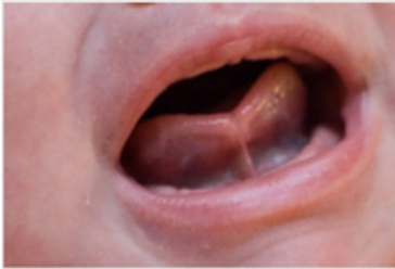
Bebek Dil Bağı

Dil Bağı: Doğuştan dilin ağız tabanına yapışık olmasıdır .Bu durum bebeğin memeye yerleşmesine engel olabilir, meme başı çatlaklarına dolayısıyla emzirmenin yetersizliğine neden olabilir.