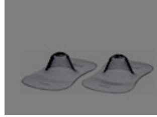
Silikon Meme Ucu