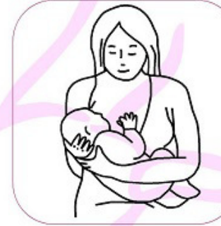
Ters kucak pozisyonu